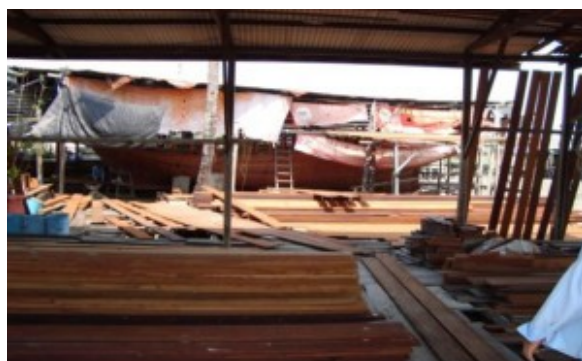
Kilang membuat bot nelayan di Pulau