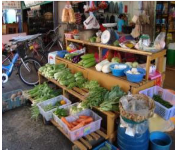
Salah satu kedai runcit yang diniagakan oleh penghuni di Pulau Ketam

Akuakultur di Pulau Ketam biasanya dijalankan di pinggir laut. Para pengusaha terlebih dahulu perlu mendapat kelulusan perlesenan. Rumah rakit juga perlu dibina, dimana rumah rakit tersebut perlu diapungkan di atas permukaan laut dengan menggunakan bekas-bekas plastik kosong. Sauh digunakan untuk menetapkan rumah rakit supaya ianya tidak digerakkan oleh ombak atau angin kencang. Kawasan untuk membina rumah rakit adalah bergantung kepada kedalaman laut dan jenis ikan yang akan dipelihara. Terdapat tiga jenis ikan yang biasanya dipelihara oleh para pengusaha termasuklah Red Snapper, Grouper (Giant Grouper dan Red Grouper) dan Sea Bass.