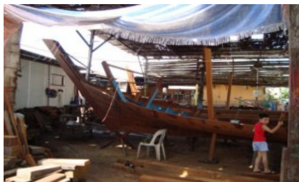
Bot nelayan dalam proses pembinaan

Namun begitu, penternak ikan juga menghadapi masalah-masalah seperti penyakit ikan. Wabak ikan hanya akan merebak sesama spesis ikan yang serupa dan ia hanya mengambil masa yang singkat untuk berjangkit. Penternakan spesis ikan yang diserang penyakit boleh diberhentikan sampai selama dua hingga tiga tahun. Selain dari itu, kenaikan harga makanan ikan juga membimbangkan para pengusaha. 90 peratus daripada kos penternakan adalah untuk makanan ikan sahaja. Oleh itu, pengusaha akan menghadapi kekurangan bekalan makanan ikan sekiranya harga makanan ikan yang semakin melambung naik.