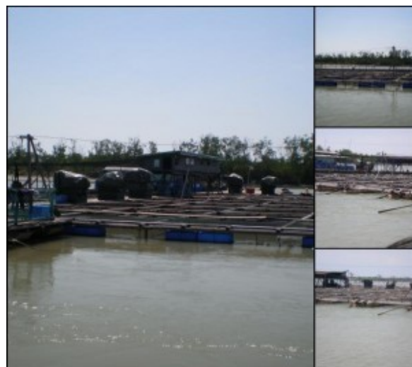
Rumah rakit didirikan di atas permukaan laut di Pulau Ketam